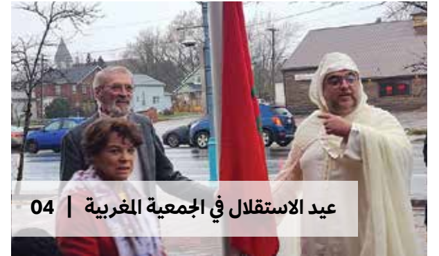
عيد الاستقلال في الجمعية المغربية | 04