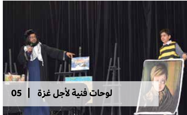
لوحات فنية لأجل غزة | 05