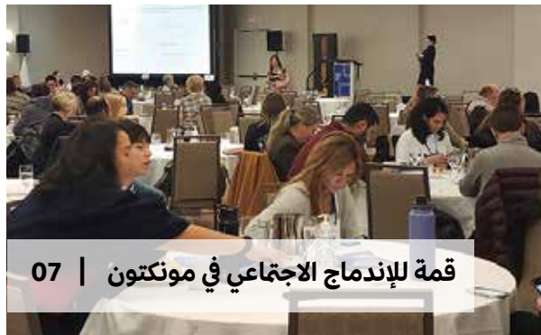
قمة للإندماج الاجتماعي في مونكتون | 07