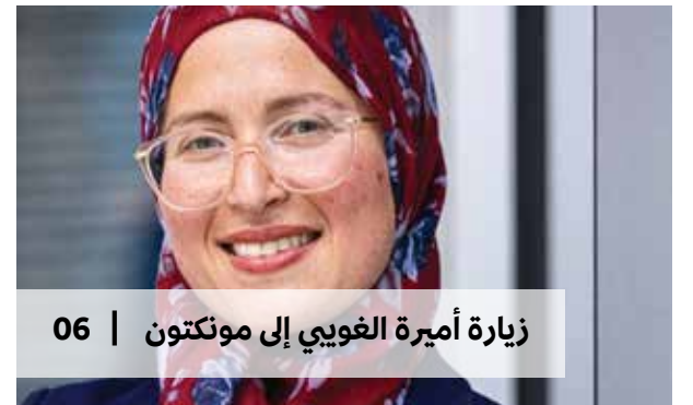
زيارة أميرة الغويبي إلى مونكتون | 06